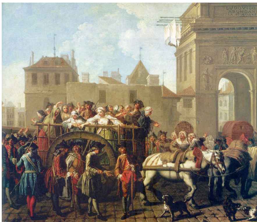
En route pour la Salpêtrière

Durant La Réforme et la Contre-Réforme on observe un retour à la morale, aussi bien chez les partisans de la nouvelle religion que chez ceux de l'Eglise. Les mœurs doivent s'assagir à cause de l'apparition de la syphilis. En France, une Ordonnance de 1560 supprime les bourdeaux.