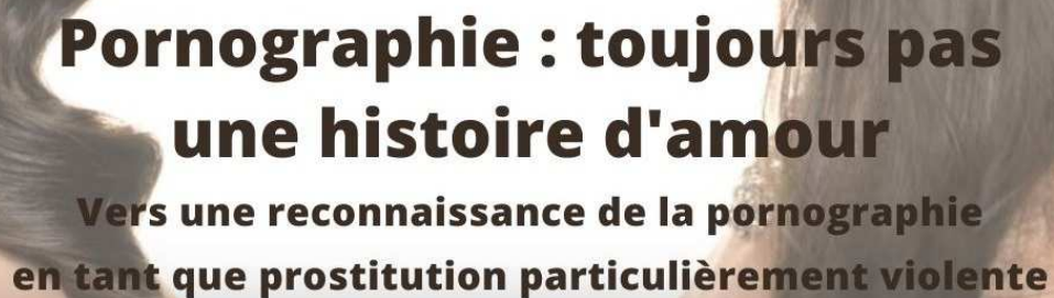
Image : ©Prix de la Fondation Scelles, « Coexistence » par Nora Hegedus, Prix du Jury 2014

Cet article est tiré du 5 ème Rapport mondial : « Système prostitutionnel : Nouveaux défis, nouvelles réponses », Fondation Scelles, Paris, 2019.